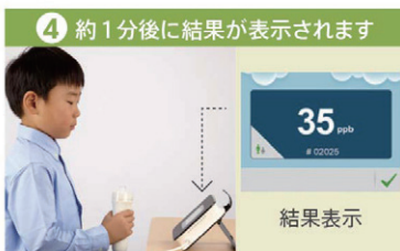
4 約1分後に結果が表示されます