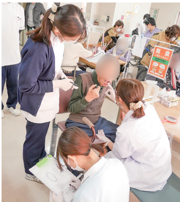
玉島歯科診療所のスタッフによる口腔検査の様子

2024年9月~2026年1月の期間、2ヶ月に1~2回、玉島歯科診療所より歯科医師・歯科衛生士・技工士などが当事業所へ来所され、口腔検査を実施し利用者さんと通所リハビリスタッフへの口腔ケア指導を行って頂きました。また、通所リハビリ利用時には、私たちスタッフが昼食後の歯磨き誘導や支援、正しい口腔ケアの指導などを行って頂きました。