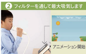
2 フィルターを通して最大吸気します