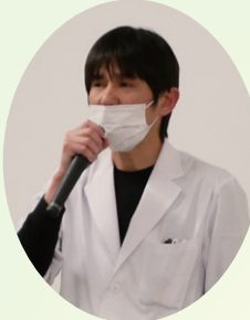
挨拶をする大地薬剤師

2月10日（火）、第6回目となる看護・介護連携の会を開催しました。今回は「自己紹介time」自分のことを知ってもらおうと、おしゃべりの会として実施しました。22名の玉島地域の在宅関係者の皆様にご参加いただき、当院からは居宅介護支援事業所、外来、訪問看護、薬局、ケアサポートセンターより計14名の職員が参加しました。