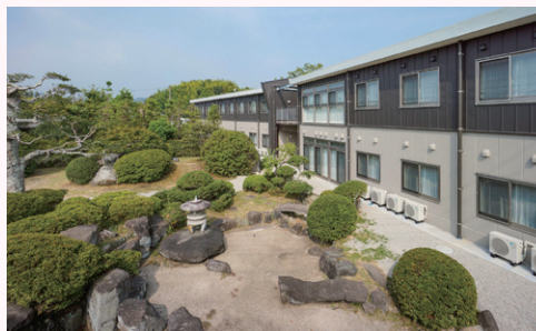
両備ヘルシーケア玉島柏島

今回、普段から連携させていただいている介護付き有料老人ホーム「両備ヘルシーケア玉島柏島」さんに、当院の職員2名が研修に行かせて頂きましたので、感想をご紹介します。